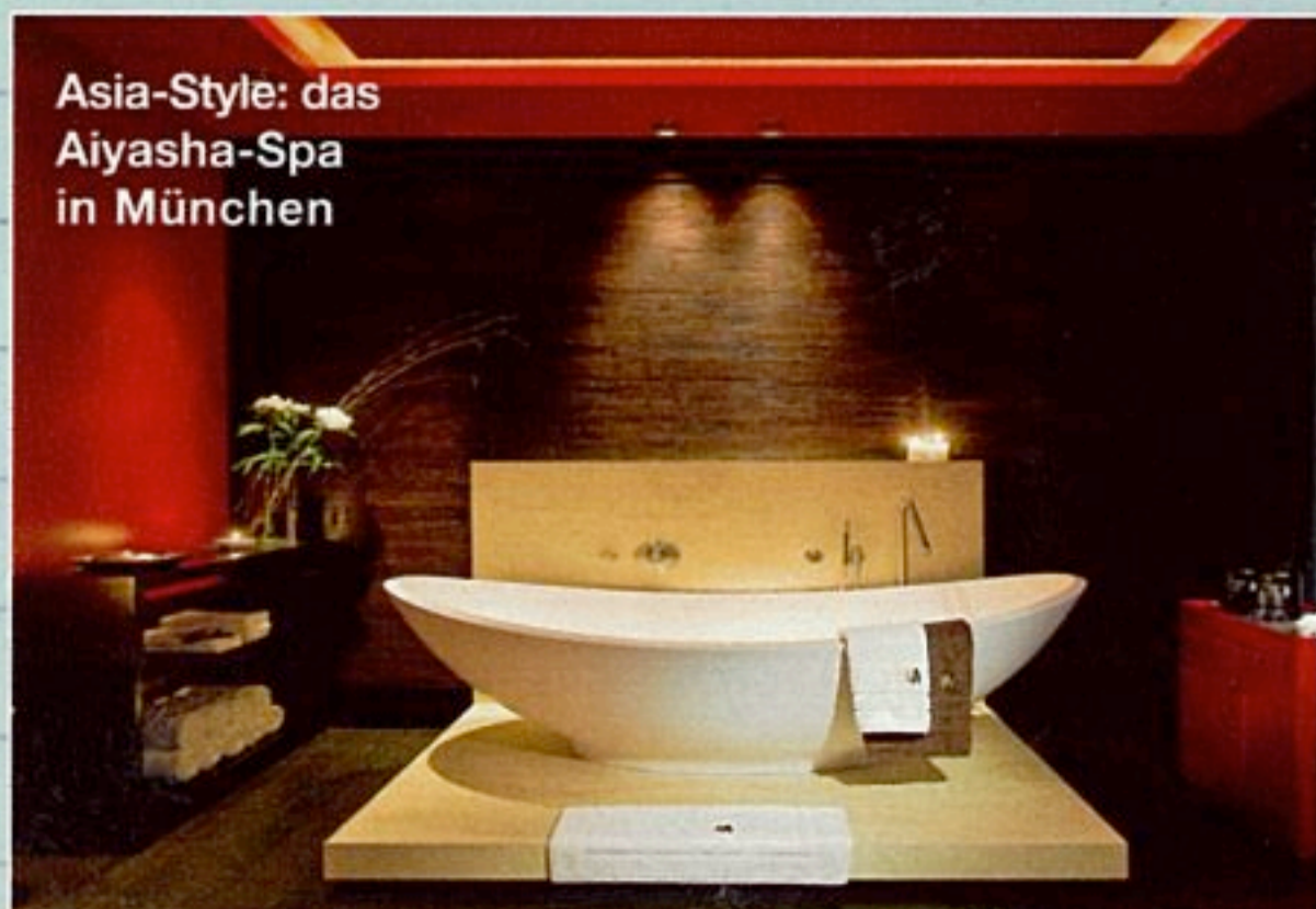
Asia-Style: das Aiyasha-Spa in München

■ Adresse Perusastraße 5, www.aiyashaspa.de