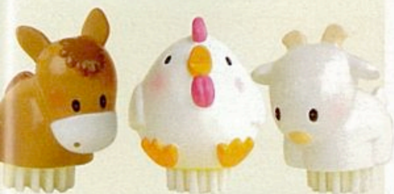
Reinlich und niedlich: Nagelbürsten mit Tiergriff

Bürstenzoo Diese tierischen Manikürehelfer machen die Nägel strahlend sauber und das Waschbecken zum Hingucker. Die Bürsten gibt's für ca. 4 € als Pferd, Huhn, Ziegenbock oder Giraffe. Über mousseshop.de