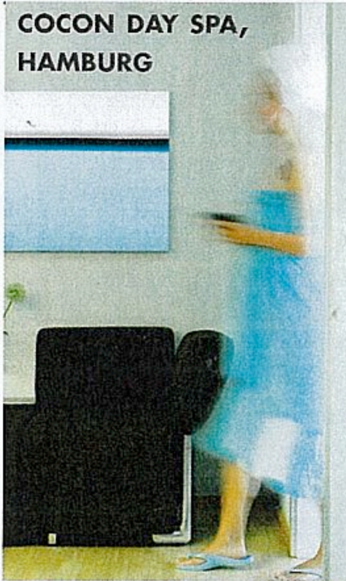
COCON DAY SPA, HAMBURG

COCON DAY SPA, HAMBURG Wer in der Hansestadt einen Ort der Ruhe und Geborgenheit sucht, ist im Cocon Day Spa genau richtig. Ein modernes Ambiente, hochwertige Produkte, innovative Treatments und professioneller Service verwöhnen Körper, Geist und Seele. Turmweg 29, 20148 Hamburg, Tel. 0 40-41 35 47 37, www.cocon-day-spa.de