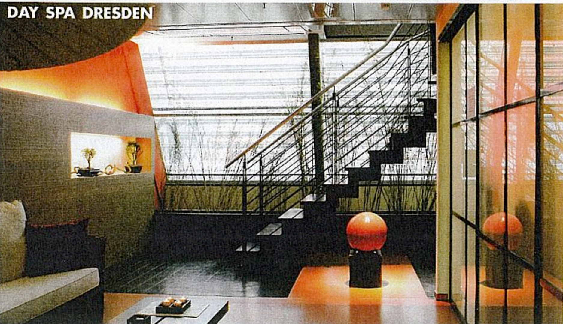
DAY SPA DRESDEN

COCON DAY SPA, HAMBURG Wer in der Hansestadt einen Ort der Ruhe und Geborgenheit sucht, ist im Cocon Day Spa genau richtig. Ein modernes Ambiente, hochwertige Produkte, innovative Treatments und professioneller Service verwöhnen Körper, Geist und Seele. Turmweg 29, 20148 Hamburg, Tel. 0 40-41 35 47 37, www.cocon-day-spa.de