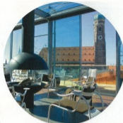
Aussicht, Angebot, Service, Ambiente – das Blue Spa im Berchtesgaden Hof ist in jeder Hinsicht gipfelfähig

Meditation – die drei Filialen des Jivamukti Yoga Center München wollen moderne Menschen alles Aha von der Kraft des Yoga übergeben. Das dies gelingt, beweisen die gut besuchten Kurse von „Basic“ für Yoga-Großwunders über „Technik“ für Fortgeschrittene. Yoga bis hin zu Stunden für Mütter mit Baby. In den lockrigen, offenen Räumen können die professionell ausgebildeten Lehrer individuell auf jedes Kurssteilnehmer ein und motivieren mit Geduld und Leidenschaft auf dem Weg zum Yoga. ► C2 Schulweg 43, Schwei-